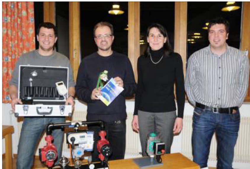
„Fairwandle dein Klima“ – organisiert von Energy-Scouts aus Rain und Atting