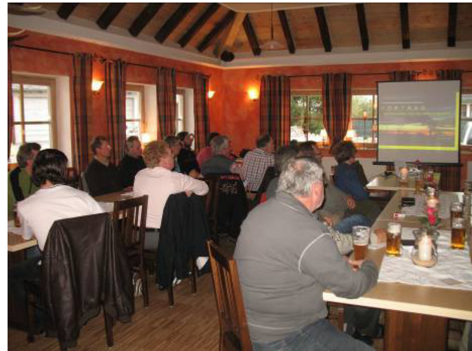
Infoveranstaltung zum Thema Sonnenhaus – organisiert vom Energy-Scout aus Parkstetten